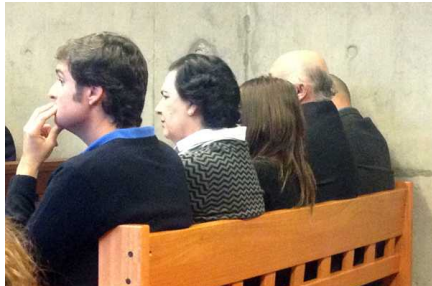
Formalizan a miembros de familia Ossandón por fraude que supera los $100 mil millones