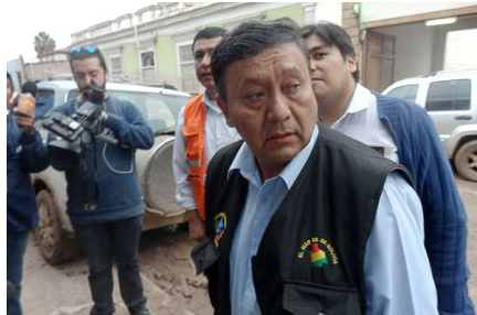
Ministro boliviano entrega ayuda en Copiapó con chaqueta alusiva a demanda marítima