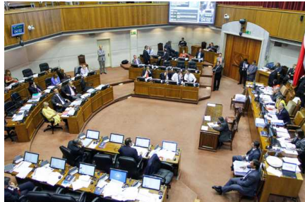
Senado aprueba proyecto de acuerdo en contra de ministro boliviano: "Fue una falta de respeto"