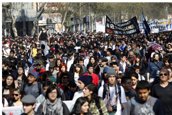
Mientras aún definen si regresan a clases, los estudiantes decidieron mantener las marchas.