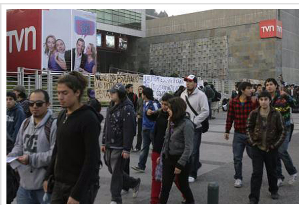
No es la primera vez en este año que el canal estatal es blanco de protestas estudiantiles, en esta imagen quedó plasmada la protesta de estudiantes de la UTEM contra un programa de TVN.