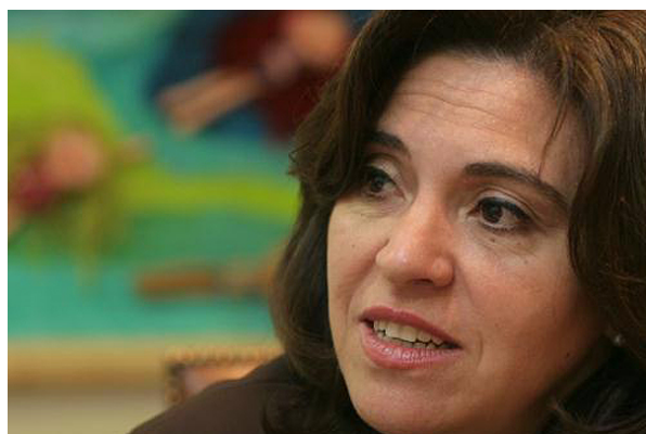
La ex ministra del Medio Ambiente, Ana Lya Uriarte detalló la postura del gobierno anterior respecto a HidroAysén.