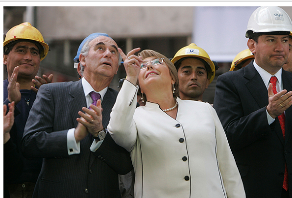
Sergio Bitar señaló que la ex Presidenta Michelle Bachelet "nunca que yo conozca" se pronunció sobre las centrales pero "sí nos indicó con claridad, que siguiéramos los ritmos institucionales".