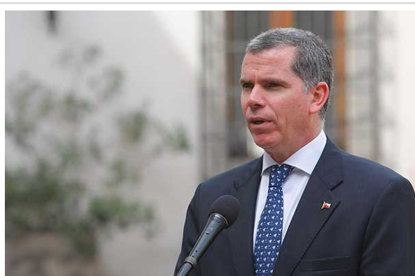
Bulnes reiteró que no se retirarán los proyectos ya presentados.