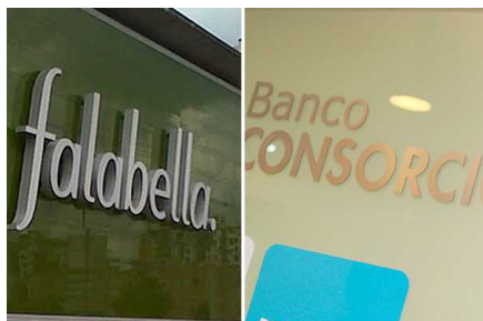
Sernac interpone demandas colectivas contra Falabella y Banco Consorcio