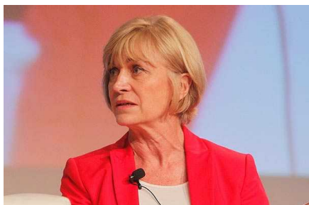
Matthei contra reforma laboral: "Es un desastre y peor que la tributaria"