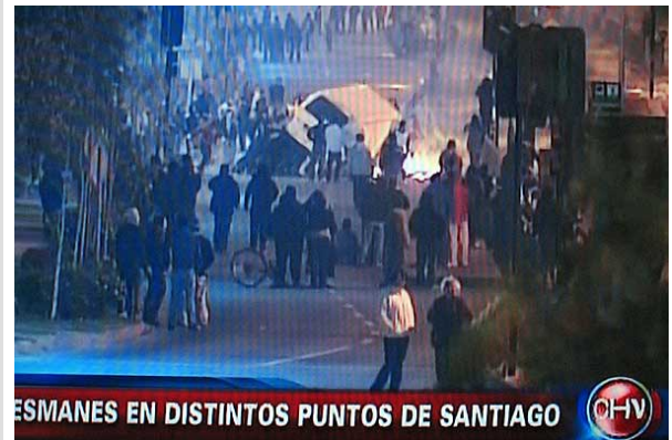
SEMANAS EN DISTINTOS PUNTOS DE SANTIAGO

Las cámaras captaron a antisociales quemando un furgón en Peñalolén.