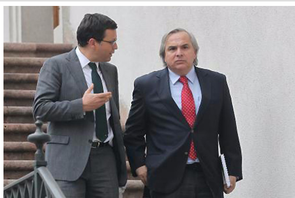
Según Chadwick, la decisión será acordada en conjunto con el ministro del Interior, Rodrigo Hinzpeter, y el subsecretario de esa cartera, Rodrigo Ubilla.