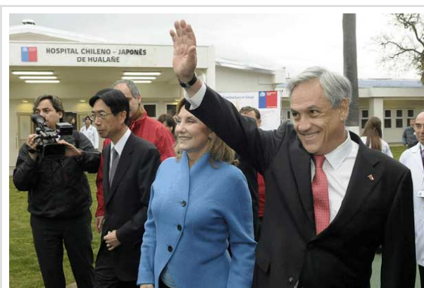
El Presidente convocó a los estudiantes desde Hualañé, donde hubo protestas menores en su contra.

Twitter 12 Compartir 6 Me gusta 74 Enviar -A +A