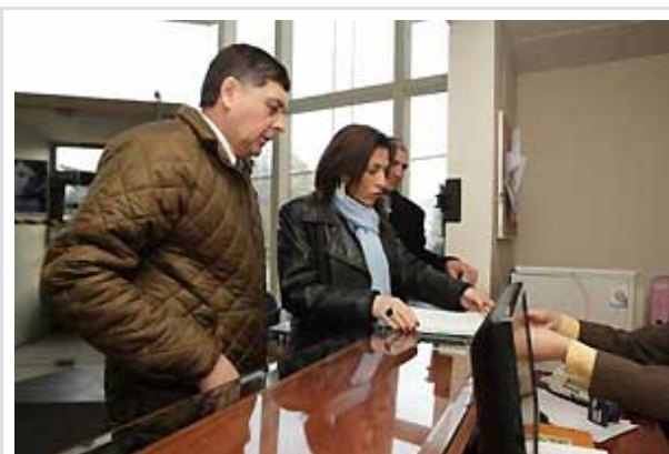
Alvarado presentó los documentos junto a la intendenta de la Región de Aysén, Pilar Cuevas.