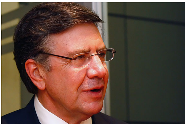
"Queremos escuchar los planteamientos de ustedes", dijo el ministro Lavín a los estudiantes.