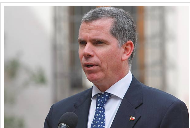
Bulnes emplazó al edil a precisar "en qué contexto supuestamente habríamos tenido este diálogo".