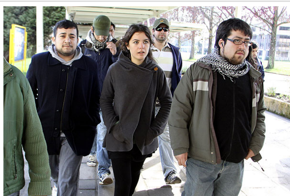
Los dirigentes de las distintas federaciones universitarias están reunidos en Temuco.