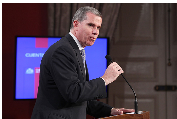
El ministro de Educación, Felipe Bulnes, entregó hoy en La Moneda su cuenta pública de este año.