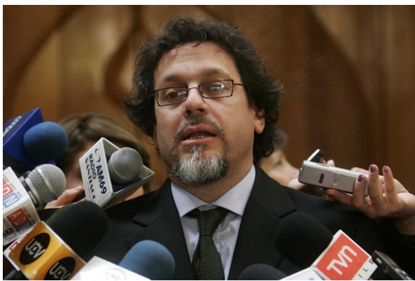
Archivo.

SANTIAGO.- El senador del Partido por la Democracia (PPD), Ricardo Lagos Weber, llamó este viernes a la administración de Sebastián Piñera asumir que fueron sus funcionarios los que aprobaron la iniciativa energética HidroAysén, rechazando que se plantee el tema como heredado y advirtió que "nadie gobierna mirando para atrás".