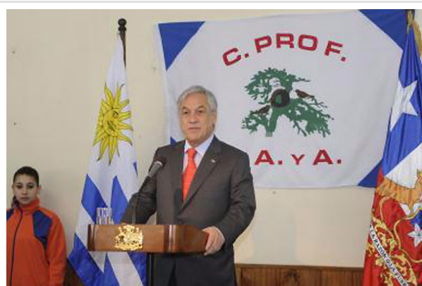
El Mandatario chileno llegó ayer a Montevideo y se mantendrá allí hasta el mediodía de mañana viernes.