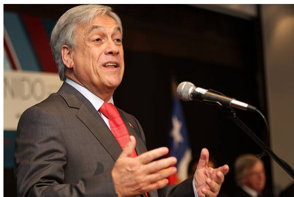
El Presidente Piñera sostuvo en Uruguay que "los

SANTIAGO.- Ante la demanda de gratuidad del movimiento estudiantil, el Presidente Sebastián Piñera insistió hoy que el Gobierno sólo puede garantizarla para el 40% más vulnerable y sostuvo que quienes estén en condiciones deben hacer un esfuerzo para pagar su educación.