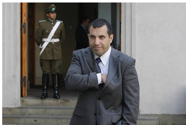
El diputado UDI afirmó que no ha habido represión, si no "violencia excesiva de manifestantes".