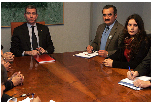
El ministro Felipe Bulnes se reunió ayer los líderes de los estudiantes y del Colegio de Profesores.