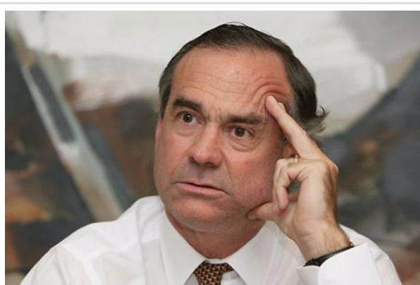
"Habría sido como incendiar la pradera", aseguró Walker.