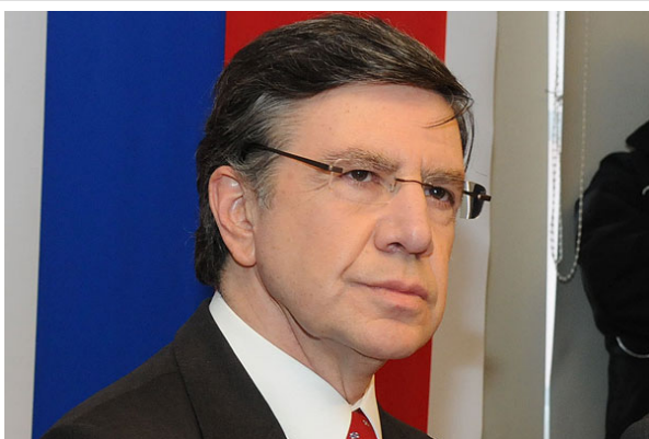
El ministro sostuvo que les contestó "carta por carta" y "punto por punto" a los estudiantes.