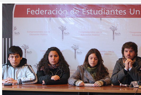
Universitarios y secundarios llamaron hoy a sumarse al paro nacional de este jueves 30.