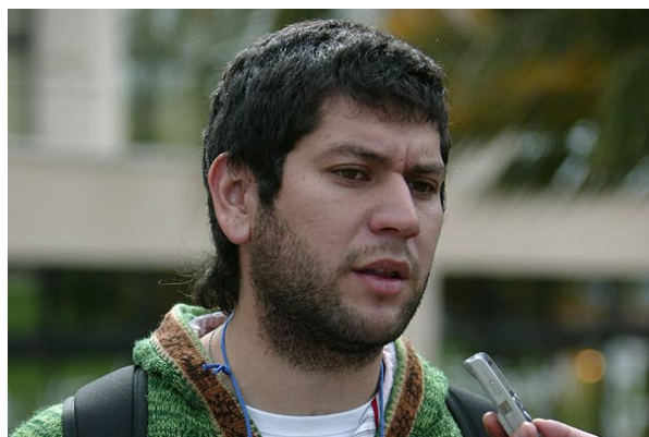
"El Presupuesto es insuficiente y debe tener mejoras", sostuvo el presidente de la Feusach.