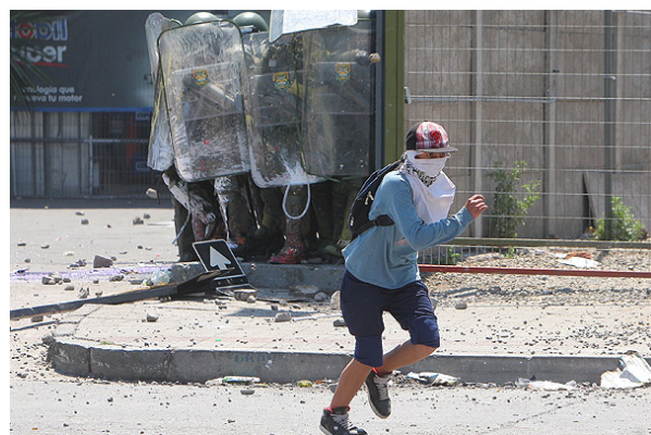
Consejeros de la CIDH criticaron el control de las manifestaciones estudiantiles en Chile.