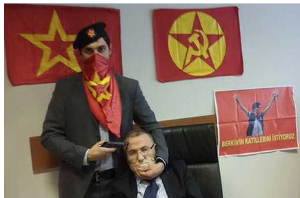
Trágico desenlace de secuestro: Mueren extremistas y fiscal que retenían en Estambul