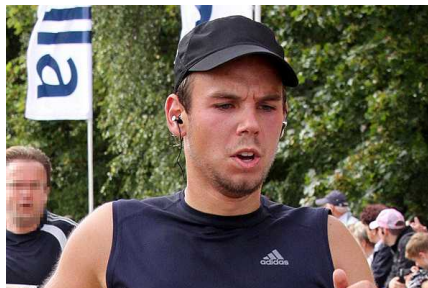
Lufthansa admite que copiloto informó de sus problemas de depresión