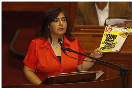
Congreso de Perú censura a Primera Ministra tras presunto espionaje