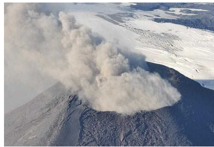
Aumenta actividad del volcán Villarrica y sus fumarolas superan los 800 metros