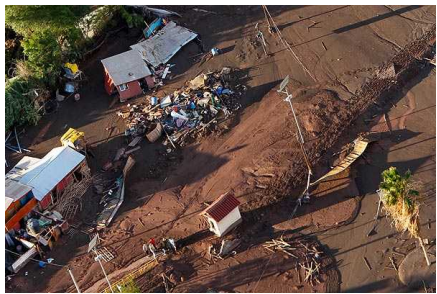
Aseguran que mujeres encerradas en un container fueron arrastradas por alud en Tierra Amarilla