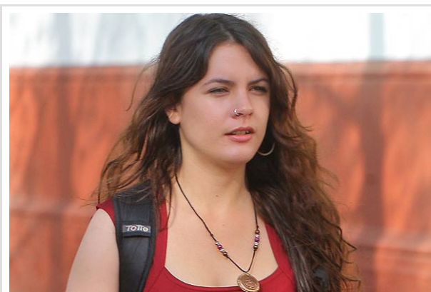
La presidenta de la FECh sostuvo que "con mesa de diálogo hay mayor razón para movilizarnos".

Emol Miércoles, 28 de Septiembre de 2011, 10:07