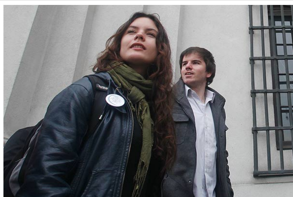
Los líderes de la Confech aclararon que la cita no es una "mesa de diálogo", sino que "un primer acercamiento" con el Presidente de la República.