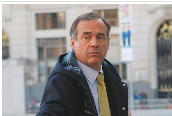
El vocero del conglomerado dijo que espera que "esa explicación sea a satisfacción del Presidente".