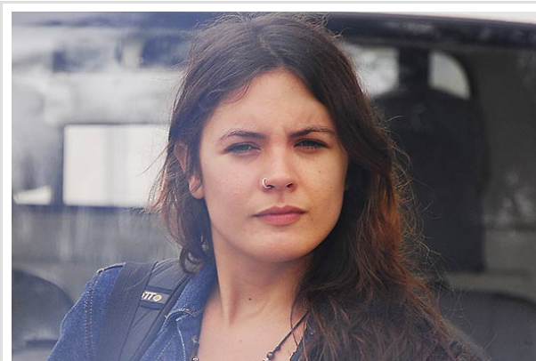
"La gente está expectante con lo que va a pasar con la Ley de Presupuesto", sostuvo la dirigente.