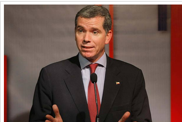
El ministro Bulnes dijo que tenía la expectativa de que los estudiantes hicieran "un primer gran gesto" y volvieran a clases, lo que no ocurrió.