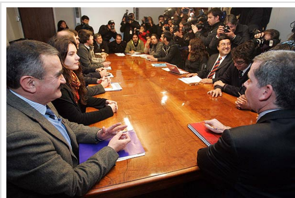
La cita entre el Gobierno y los estudiantes se inició pasadas las 17.00 horas en la sede del Mineduc.

SANTIAGO.- Por cerca de dos horas y media se extendió la esperada primera cita de la mesa de trabajo el Gobierno y los estudiantes para intentar destrabar el conflicto estudiantil, que se prolonga por más de cuatro meses.