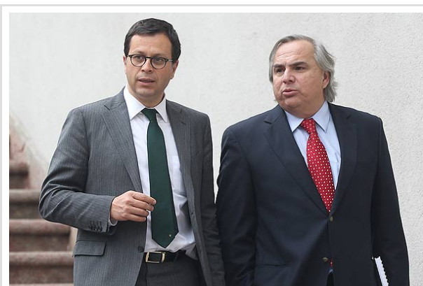
El ministro Andrés Chadwick acusó que desde la oposición están buscando "politizar" la situación.

SANTIAGO.- El vocero de Gobierno, Andrés Chadwick , sostuvo que las peticiones que han surgido para que el ministro del Interior, Rodrigo Hinzpeter, renuncie a su cargo esgrimiendo una presunta responsabilidad política en la muerte del menor en Macul carecen de fundamento.