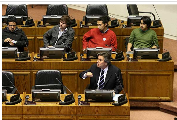
Dirigentes de la Confech participaron hoy del debate en Comisión del Senado sobre educación.