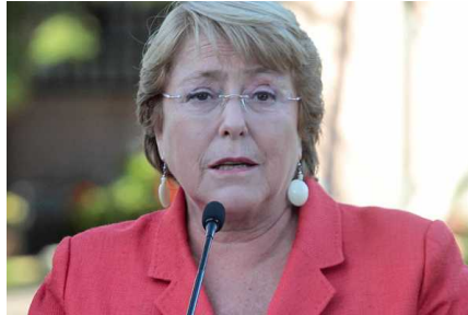
Bachelet enfrenta reclamos de afectados por graves temporales en el norte