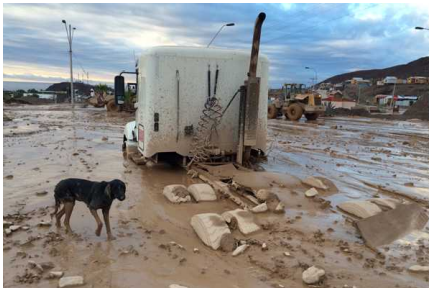
Elevan a nueve los fallecidos por temporales y mantienen toque de queda en Atacama