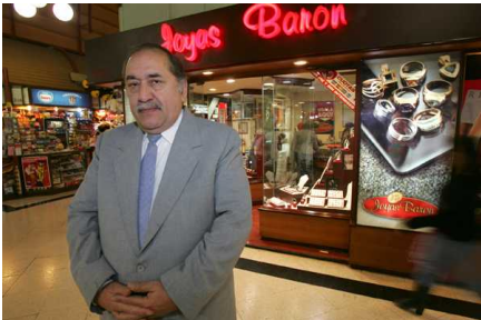
Condenan a dueño de Joyerías Barón a 5 años de libertad vigilada por delito tributario