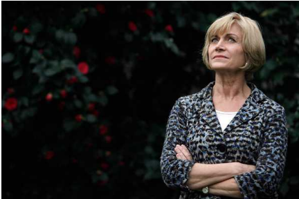
Matthei lanza duro ataque contra Peñailillo por caso SQM: "Es indignante su doble estándar"