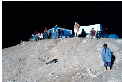
Copiapó: Decenas de vecinos pasaron la noche en los cerros tras alud en localidad de Paipote